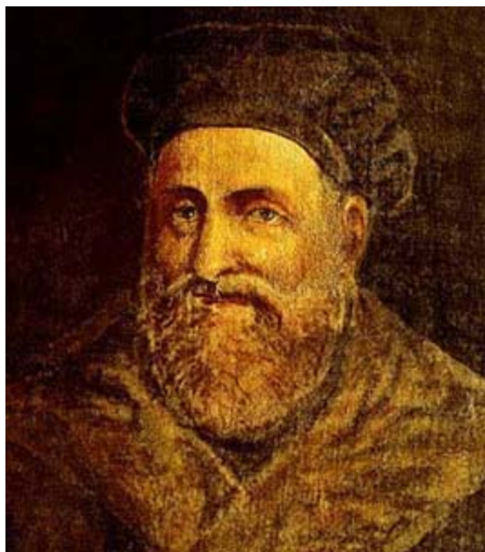
Рис. 1. Габриеле Фаллопио.

450 лет назад (9 октября 1562 года) скончался выдающийся итальянский анатом Габриеле Фаллопио (латинизир. Фаллопиус) (рис. 1), которого великий французский естествоиспытатель Жорж Кювье (1769-1832) считал основоположником научной анатомии наряду с Андреем Везалием (1514-1564) и Бартоломео Евстахио (ок. 1510-1574).